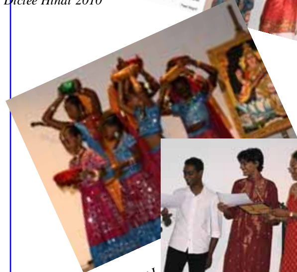
8e Anniversaire du CGPLI