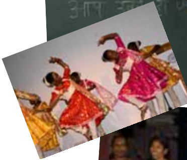
Ecde de Danse CGPLI