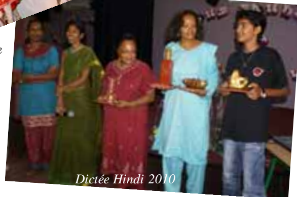
Dictée Hindi 2010

wartly wa8a pčar pir8d -6vdl p — CONSEIL GUADELOUPÉEN POUR LA PROMOTION DES LANGUES INDIENNES — , ej ja nkhop gugG fofk - Fthj YgG