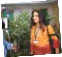
Ganesha : Option Hindi au bac 2010